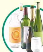
Les emballages en verre