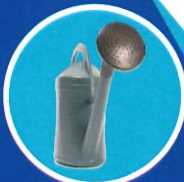
Objets en plastique