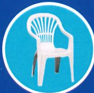
Mobilier de jardin